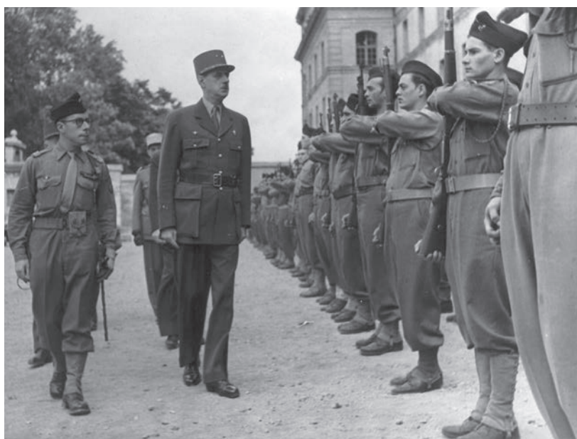
Paris, caserne de La Tour-Maubourg, 18 juin 1945. Le général de Gaulle passe en revue un détachement du bataillon du Pacifique.

Enfin, en tant que Président du Gouvernement provisoire de la République française (GPRF), puis Président de la V e République, il sera présent dans la cour d'honneur des Invalides à l'occasion de prises d'armes, de remises de décorations, de commémorations. Certains moments resteront historiques : le maréchal Montgomery fait grand-croix de la légion d'Honneur (1945), la remise de la médaille militaire à Winston Churchill (1947), le transfert des cendres du maréchal Lyautey (1961), les funérailles du maréchal Juin (1967), inhumé dans la crypte ou encore son discours prononcé à l'occasion du cinquantenaire de l'armistice du 11 novembre dans lequel il rend un dernier hommage à l'armée et à la population française.